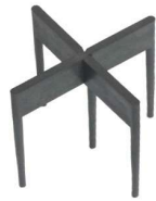
Fugenbreite 4 mm