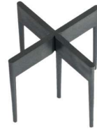
Fugenbreite 6 mm